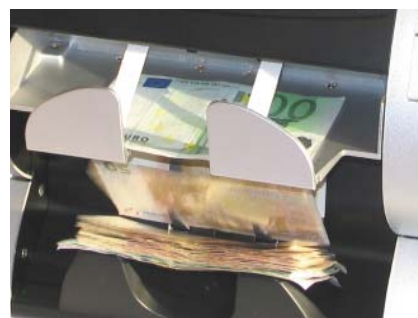
2e pocket (reject pocket) voor valse biljetten of voor gebruik tijdens non-stop sorteren