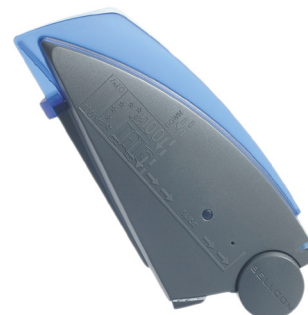
€vision FM kan met bijgeleverde schroef bevestigd worden aan bijv. de kassa.