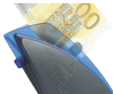
€vision is makkelijk in gebruik.